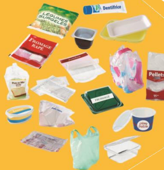
Autres EMBALLAGES plastiques