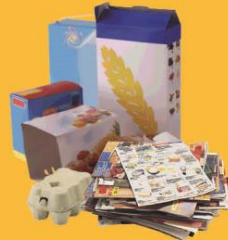
Papier & emballages en carton fin