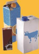
Briques en carton