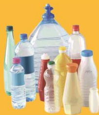
Bouteilles & flacons plastiques

Je ne suis pas une poubelle mais un bac de TRI !!