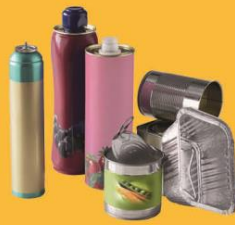
Emballages en métal & Aérosol